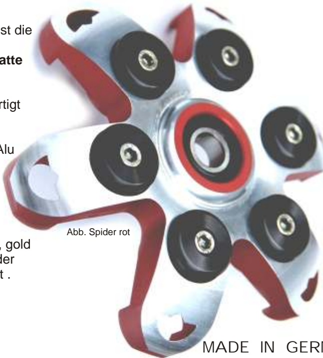
Abb. Spider rot

Lieferbare Farben der "SPIDER": schwarz, rot, gold Mitnehmerscheibe: Standard in silberglanz- oder gegen 25,- € Aufpreis mit Echtgold beschichtet.